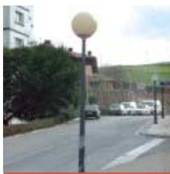
REHABILITACIÓN ALUMBRADO ARGITERIA ZAHARBERRITZEA