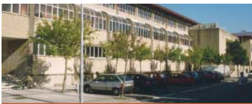
REFORMAS EDIFICIOS DEPORTIVOS KIROLEKO ERAIKINAK ERREFORMATZEA