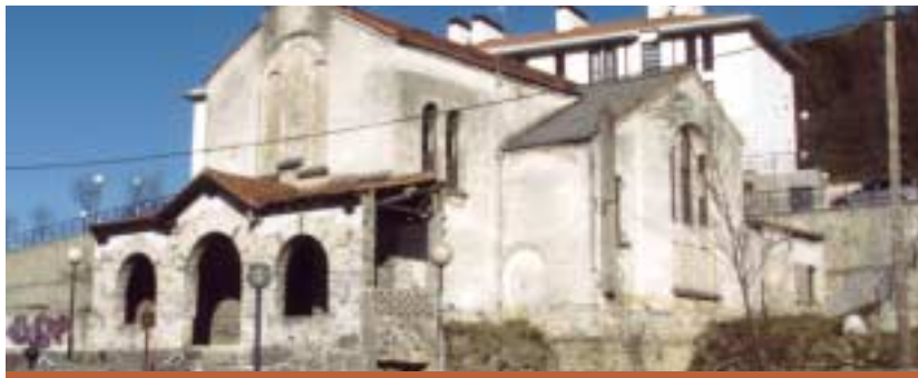
REFORMA CAPILLA DEL CARMEN KARMENGO KAPERA ERREFORMATZEA