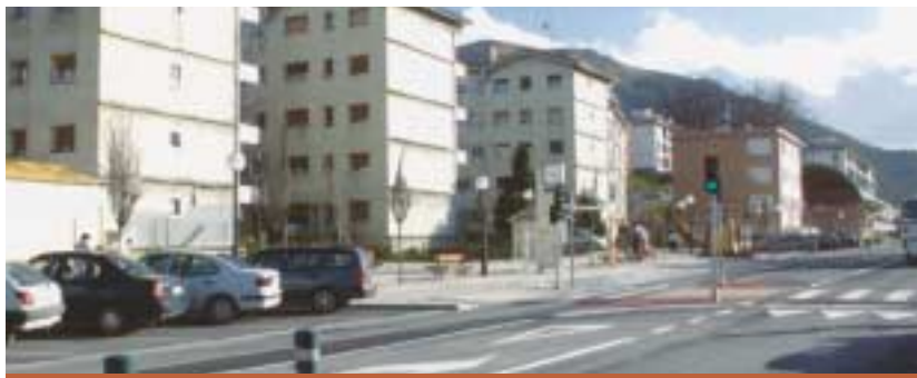
RENOVACIÓN ACERAS ZIRKUITO ETORBIDEA ZIRKUITUKO IBILBIDEKO ESPALOIAK BERRITZEA