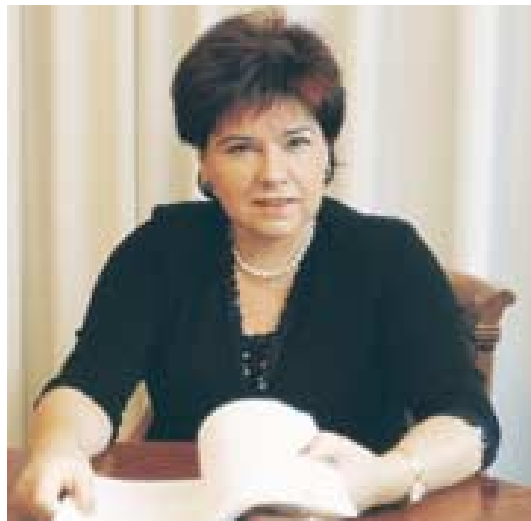
Ana Urchueguía Asensio Alcalde de Lasarte-Oria