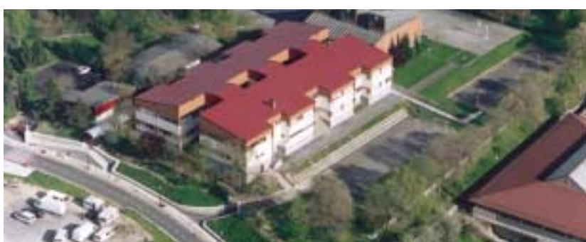
REFORMA CENTROS ESCOLARES IKASTETXEA ERREFORMATZEA