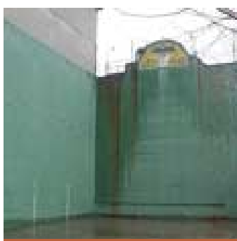
REFORMA FRONTÓN MICHELÍN MICHELINGO FRONTOIA ERREFORMATZEA